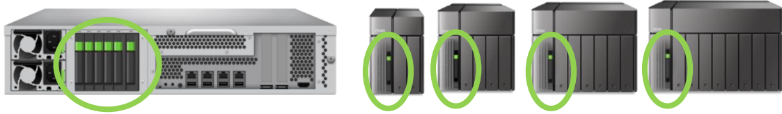
▲緑で囲ったエリアが SSD 専用スロット